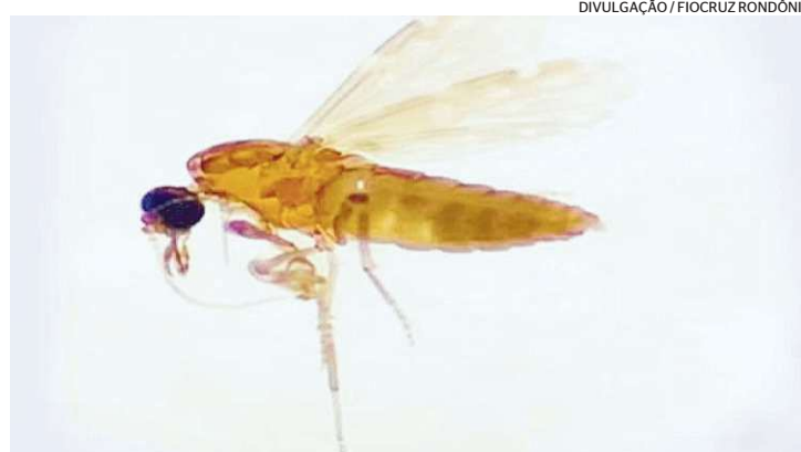
Mosquito transmite o vírus que causa a febre oropouche

— Exames apontaram a existência de material genético do vírus em diferentes tecidos do bebê, que nasceu com microcefalia, malformação das articulações e outras anomalias congênitas. A análise também descartou outras hipóteses diagnósticas. No entanto, a correlação direta da contaminação vertical de Oropouche com as anomalias ainda precisa de uma investi-